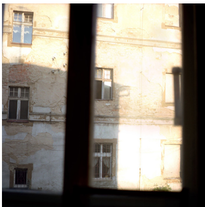
Ил. 9–11. Алиция Добруцка, «I like you, I like you a lot». 2008–2016.