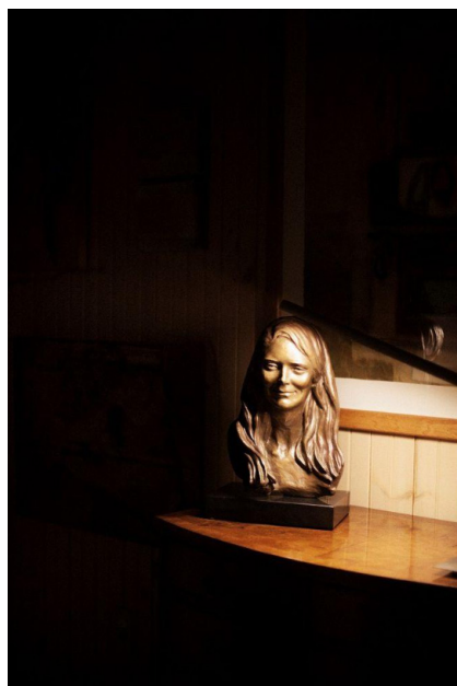
Ил. 12–13. Лайя Абрил. «Эпилог», 2014.