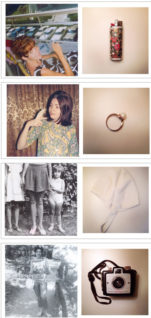
Ил. 5–8. Дженнифер Лёбер. Проект «Left behind». 2014.