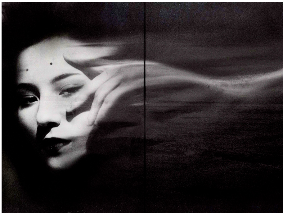
Ил. 7. Артемий Соколов. Из серии «Араси». 2019

призрачность используется фотографом в качестве средства дематериализации образа и его художественного обобщения. В серии «Двойная экспозиция» призрачность реализуется не как растворение субъекта, но как его скрытое присутствие в неожиданном контексте, порождающее гибридные образы в полном соответствии с сюрреалистическим принципом «удивительных сопоставлений».