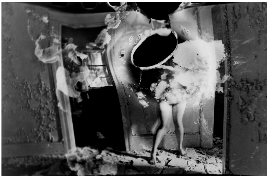
Ил. 1. Ребекка Кэрнс. Без названия. 2012

Проблематика отношений субъекта и пространства схожим с работами Ф. Вудман и Р. Кэрнс образом обыгрывается в серии фотографий Сильвии Грав «Потерянные фотографии» (Ил. 2–3). В двух парных работах испанской фотохудожницы, объединенных идентичным местом действия, мы видим фигуры мужской и женской моделей в пространстве старого, полуразрушенного дома, которые повисли над полом словно в состоянии полета. «Потерянные фотографии» – это снимки, с которых исчез (или собирается исчезнуть) человек.