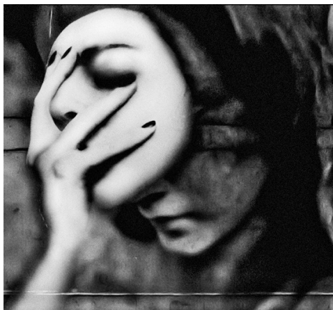
Ил. 4. Валери Кабис. Двойная жизнь V. 2008