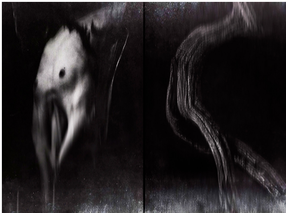
Ил. 8. Артемий Соколов. Из серии «Аокигахара». 2019

в которой человек проживает опыт грядущего отсутствия, не-бытия собственного «я».