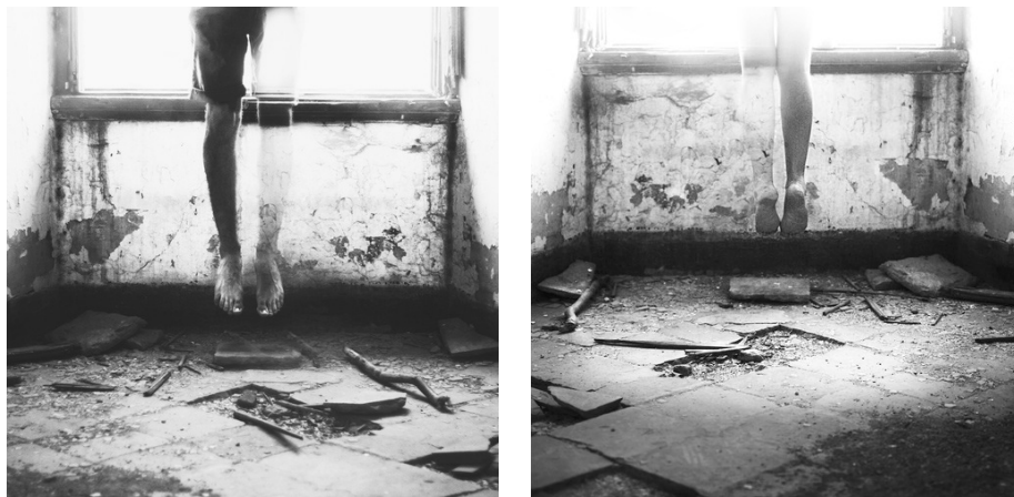
Ил. 2–3. Сильвия Грав. Из серии «Потерянные фотографии»